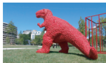
田園調布せせらぎ公園 隋建国