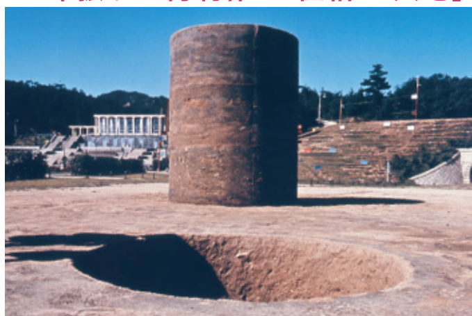
田園調布せせらぎ公園 関根伸夫「位相 - 大地」