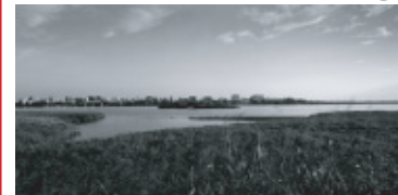
羽田空港、京急空港線 ベー・ビヨンウ