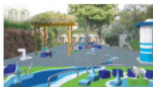
矢口南児童公園 渡辺元佳&des+art