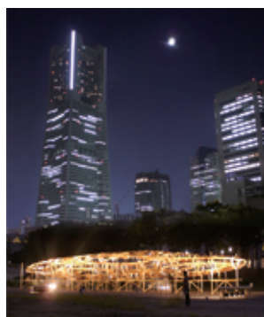
田園調布せせらぎ公園 フロリアン・クラール